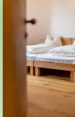
Eingangshalle, Speisesaal, Bistro, (Bad, Zimmer z.B.)